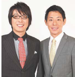
神奈川県住みます芸人 團碁将棋