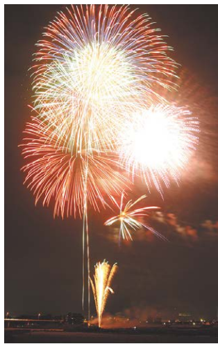
▲第18回あしがら花火大会