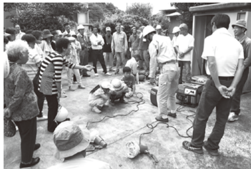
虫沢田代自主防災会の訓練 (昨年の様子)

9月2日(日)午前8時から、町内各所で総合防災訓練を実施します。地域の防災力を高め、安全で安心な町をつくるためには、町民の一人一人が正しい防災知識を身に付けることが必要です。各自主防災会(自治会単位)で実施される防災訓練に、ぜひご参加ください。