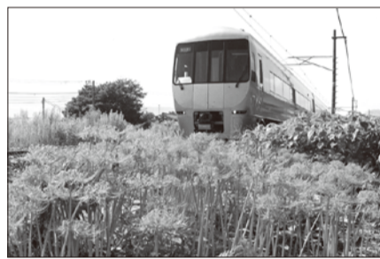
第2回入賞作品「彼岸花の咲く頃」

御殿場線活用推進協議会では「御殿場線沿線写真コンテスト」の作品を8月末まで募集しています。詳細は公式サイト「ごてんば線ネット」をご覧ください。御殿場線の新しい魅力を発信できるような力作をお待ちしています!