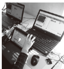
タブレットに入っているテキストを見て操作します

マイクロビットは、プログラミングして操ることができ、小さなコンピュータです。外付けのマイクロビットを使い、パソコンから命令を与えてLED電球(5×5)を光らせたり、スピーカーを付け