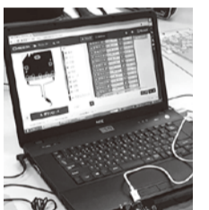
パソコンにマイクロビットをつなぎます

ム言語」を習得するために、ビジュアル・プログラミング言語とテキスト言語を学び、実施にあたっては、プログラミン