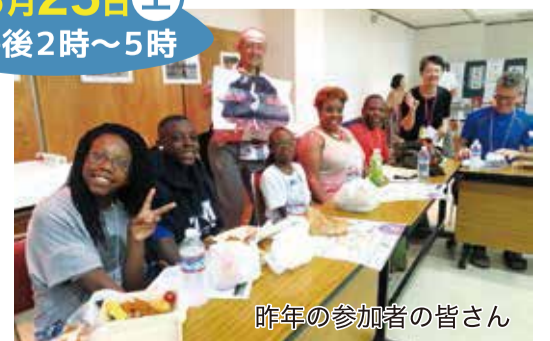
昨年の参加者の皆さん

町国際交流ボランティアや、町民有志、各種団体の皆さんにご協力いただき、今年も国際交流ツアーを実施します!約40人の外国人ゲストをお招きし、日本文化体験などを行った後、大名行列を見学します。参加者は「藍染」または「ろうバイ染め(薄い黄色)」の手ぬぐいを身に付けていますので、会場や町中で見かけたら、ぜひ交流してみてください! 【問い合わせ】(一社)松田町観光協会 ☎(85)3130