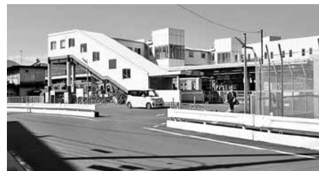
南口整備は今後も予定されている