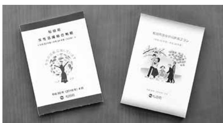
計画書に基づき事業展開される