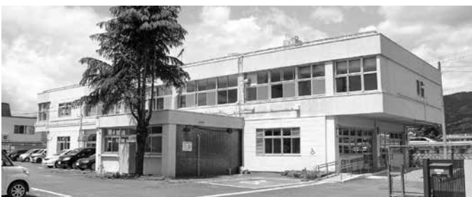
子育て支援センターなどが入る創生推進拠点施設(旧土木事務所)

選をする。図書館という機能であるので、多くの人たちに足を運んでもらえるよう努力をしていく。