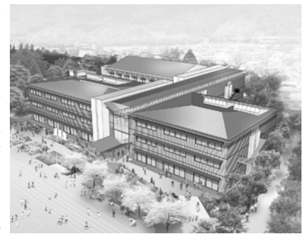
松田小学校校舎イメージ図

(1) 令和2年6月までに実施設計を完了し、9月以降に建設工事に着手されますが、住民説明会で出された要望や意見はどのような手法で設計に反映されるのか。松田の松や杉は活用されるのか。 (2) 最優秀提案業者からは、災害時における屋外設備として必要な下水道直結式仮設トイレや、貯