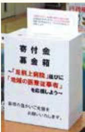
役場2階でも寄附を受け付けています

500万円（医療用ガウン5,000枚分） ※5月22日時点寄附額 2,070,500円