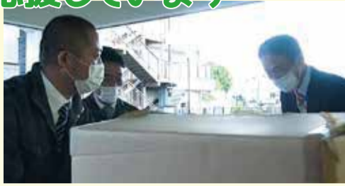
足柄上病院への 物資搬入の様子

新型コロナウイルス感染症が国内外で猛威を振るう中、県立足柄上病院は感染症の中等症患者を受け入れる「重点医療機関」に位置付けられました。