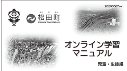
オンライン学習 マニュアル

予測困難なこれからの社会をたくましく切り拓き、持続可能な社会を形成する力を子どもたちが身につけるために、町内の小・中学校では、これまでICT機器を活用した教育を強く進めてきました。現在、小学5年生と3年生のすべての児童・生徒が使用できるタブレット端末が整備されています。臨時休業前までは、グループで話し合いをするときに活用したり、飛び箱や縄跳びを撮影した動画でフォームをチェックしたり、松田小と寄小をつなぐ遠隔授業などで活用してきました。 しかし、タブレット端末を持ち帰り、家庭学習に活用するまでには至っていませんでした。 そこで町では、臨時休業中の子どもたちの学びを補償するために、「オンライン学