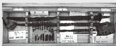
出土した直刀及び鉄鏃

前回、庶子の諏訪家敷地内の古墳跡から直刀・鉄鏃などが発見されたことをお伝えしました。現在、出土した直刀5本と鉄鏃14本は町指定文化財となっており、諏訪家で大切に保管されています。