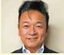
きたかわ だいすけ 北川 大介さん (歌手)