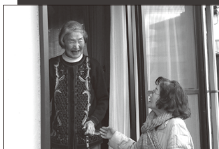
民生委員による見守り活動

民生委員児童委員は、国や県から委託を受けている非常勤特別職の地方公務員です（任期は3年間）。 担当地区の方が元気に暮らしているかどうか、見守りや声掛けを行うほか、登校時の児童の見守り活動、町や社会福祉協議会などの