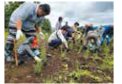
昨年の植樹の様子

日時 7月5日(日) 午前9時開始 場所 コキアの里(自然館北側の畑。自然館より徒歩5分。詳細は町公式サイトにて)