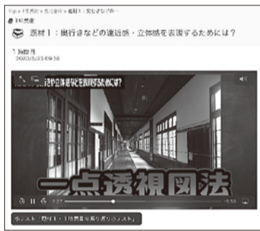
美術科の授業動画

「ズーム」というテレビ会議システムを活用して、同時双方向による各クラスごとの朝の会や全校児童による朝会が行われました。久しぶりに顔を合わせる事ができたうれしさから、予定していた30分があつという間に過ぎてしまいました。