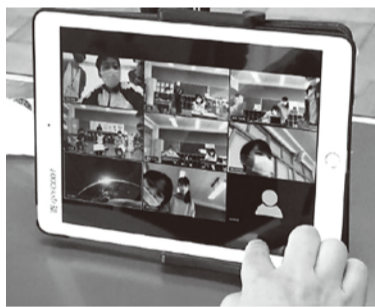
タブレットを使った全校朝会の様子