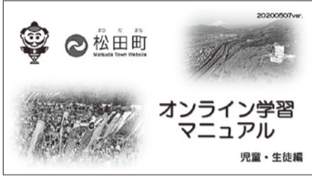
オンライン学習 マニュアル

予測困難なこれからの社会をたくましく切り拓き、持続可能な社会を形成する力を子どもたちが身につけるために、町内の小・中学校では、これまでICT機器を活用した教育を強く進めてきました。現在、小学5年生と3年生のすべての児童・生徒が使用できるタブレット端末が整備されています。臨時休業前までは、グループで話し合いをするときに活用したり、飛び箱や縄跳びを撮影した動画でフォームをチェックしたり、松田小と寄小をつなぐ遠隔授業などで活用してきました。 しかし、タブレット端末を持ち帰り、家庭学習に活用するまでには至っていませんでした。 そこで町では、臨時休業中の子どもたちの学びを補償するために、「オンライン学