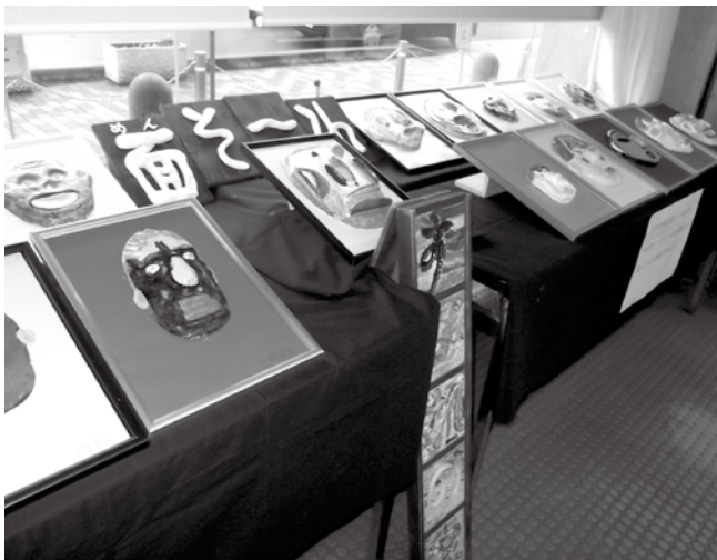
個性豊かな作品が出品された昨年の会場

「障害者週間」は、1週間に設定されました。平成16年6月の障害者基本法の改正により従来「障害者の日」(12月9日)に代わるものとして発足しました。国際障害者デーであり、また障害者基本法の公布日でもある12月3日を起点とし、従来の障害者の日であった12月9日までの1週間、国民の間に広く障害者の福祉について関心と理解を深め、障害者が社会、経済、文化その他あらゆる分野の活動に、積極的に参加する意欲を高めることを目的として設けられています。 開成町、箱根町、真鶴町、湯河原町)では障害者文化事業を実施します。今年度は例年行っている作品展・手作り製品の販売や楽器演奏などに加え、初めてアート作品コンクールを開催します。 【問い合わせ】 健康福祉課福祉推進係 ☎(83)1226