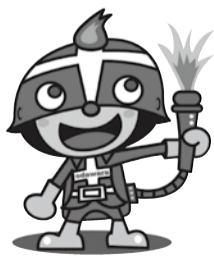
愛称をお願いします

あり、選考の結果、デザインが決定しました。今回、このキャラクターの愛称を募集します。広域化後の消防をアピールでき、世代を問わず広く愛されるキャラクターの愛称(名前)をお寄せください。