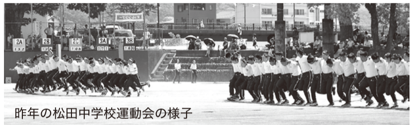
昨年の松田中学校運動会の様子