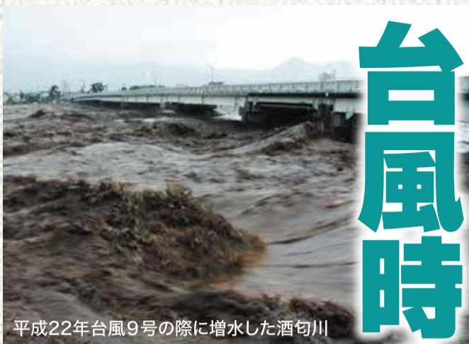
平成22年台風9号の際に増水した酒匂川