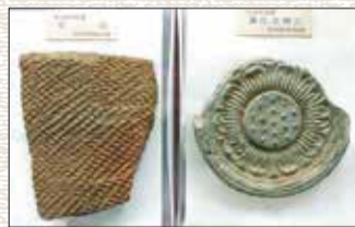
出土した瓦 ～町民文化センターに展示～

瓦づくりの技術が日本に伝わったのは588年だとされています。この前年、崇徳論争などで対立していた物部氏を倒した蘇我氏は、寺院造営のための技術者派遣を朝鮮半島の百濟に依頼します。その結果、技術者などが渡来するのですが、その中に4名の「瓦博士」もいたのです。蘇我氏が彼らの力を借りて建立したのが日本最古の寺院「飛鳥寺(法興寺)」です。