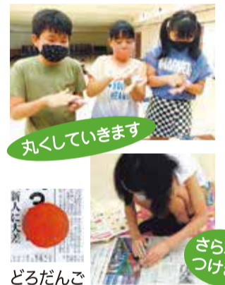
丸くしていきます

参加した9人の子どもたちは、どろの感触を味わいながら、ていねいにていねいに丸くしていきました。ピカピカになるには3時間余りかかるので、お楽しみは家に帰ってからとなりました。