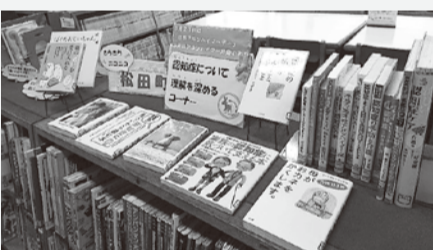
昨年度の展示内容